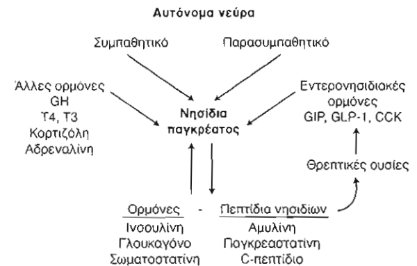
Πίνακας 1. Παράγοντες ρυθμίζοντες την έκκριση ινσουλίνης.

Προκειμένου η γλυκόζη να διεγείρει την έκκριση της ινσουλίνης πρέπει να εισέλθει μέσα στο β κύτταρο και ο κύριος ρυθμιστικός παράγοντας είναι η δραστηριότητα του ενζύμου γλυκοκινάση. Η γλυκοκινάση προκαλεί τη φωσφορύλιωση της γλυκόζης σε 6-φωσφορική γλυκόζη, η οποία στη συνέχεια υφίσταται γλυκόλυση προκειμένου να παράγει αδενοσινοτριφωσφορικό (ATP). Αυτό έχει ως συνέπεια την σύγκλιση των διαύλων καλίου της κυτταρικής μεμβράνης του β